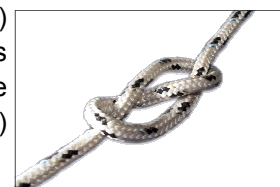
Nœud en huit (p. 149)

Les nœuds Attention, attention ! Si tu veux ajouter d'autres cordes de couleurs à la corde blanche déjà en ta possession, il te suffit de bien apprendre les nœuds suivants, expliqués dans le De notre mieux : pour la corde jaune , le nœud simple (p. 147), le nœud plat (p. 151), le nœud batelier (p. 160) et la surliure (p. 168). Pour obtenir la corde verte , tu dois apprendre le nœud de bois (p. 167), le nœud coulant (p. 170), le nœud en huit (p. 149), le nœud capucin (p. 148) et le nœud tête d'alouette (p. 156). Si tu as envie d'un bon défi et mettre tes talents à l'épreuve, la corde bleu est pour toi : le nœud d'écoute (p. 153), le nœud du pêcheur (p. 157), la demi-clé (p. 164), le nœud de chaise (p. 166) et le nœud de brélage carré (p. 172). Bonne chance.